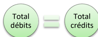
Figure 4. Mécanisme de la partie double

Pour chaque opération, le total des sommes enregistrées au débit doit être égal au total des sommes enregistrées au crédit . C'est le principe du mécanisme de la partie double .